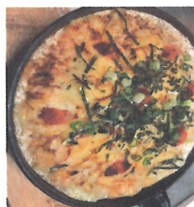
とろとろ鉄板焼き