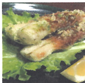
ちくわ納豆磯辺揚げ