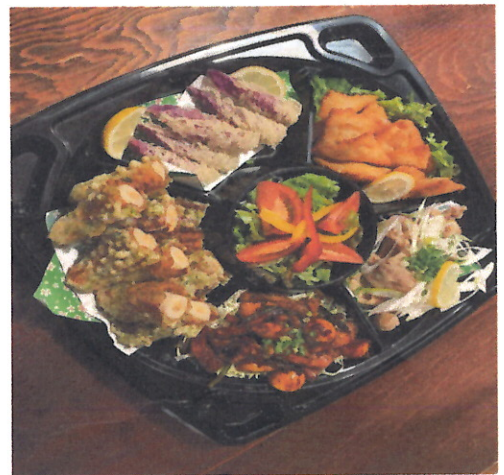
持ち帰り専用オードブル 3500 円