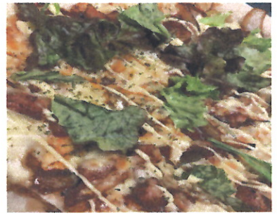
今日のイチ押しピザ ※日替わりの為お尋ねください